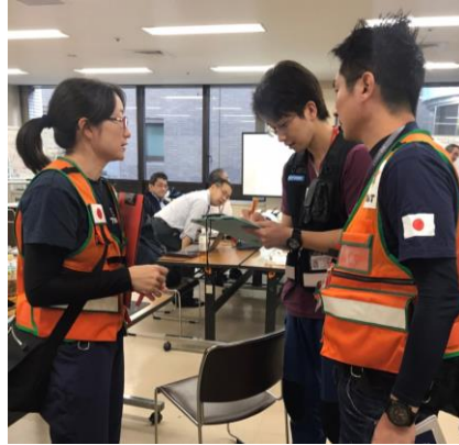
宮城県庁訪問の様子