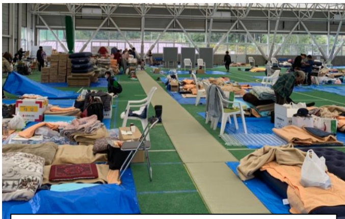
北部スポーツ・レクリエーションパーク避難所の様子