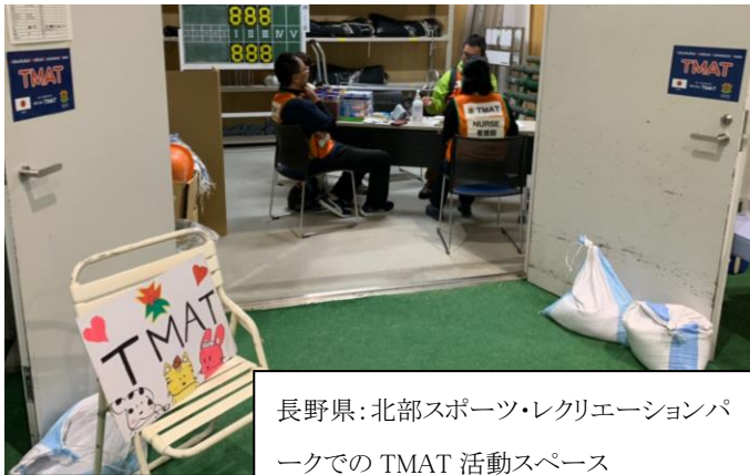
長野県：北部スポーツ・レクリエーションパークでの TMAT 活動スペース