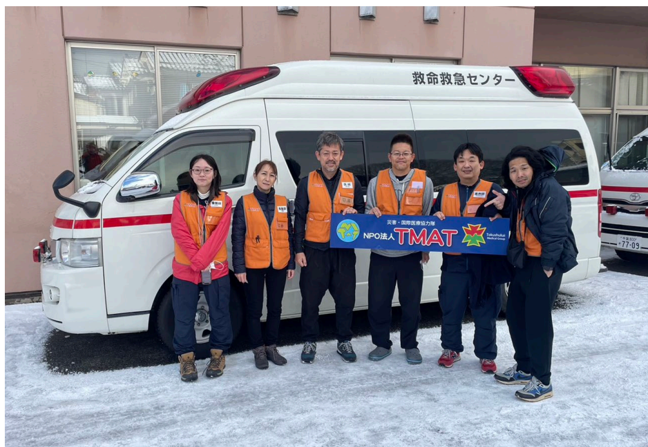
本日撤収の本隊宇治チーム