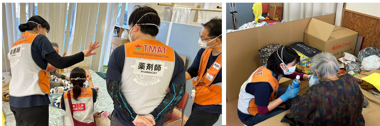
避難所内での巡回診療、環境整備の様子