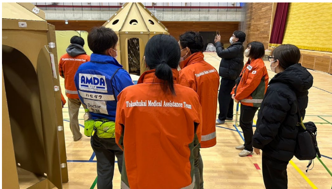
輪島中学校の視察