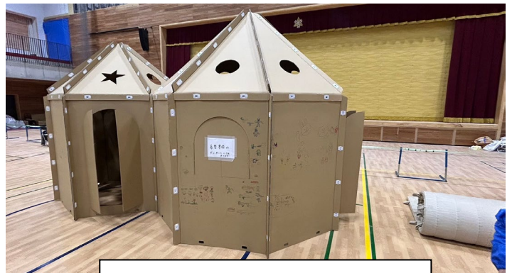
着替えができる段ボールハウスが設置されている