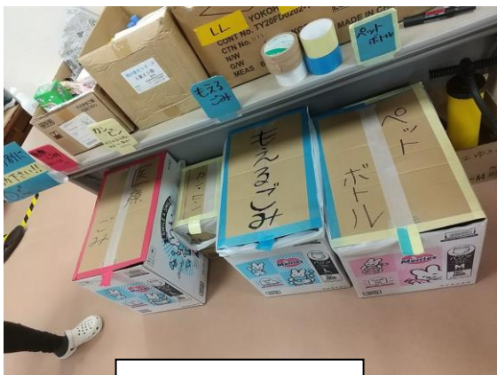
再作成したゴミ箱