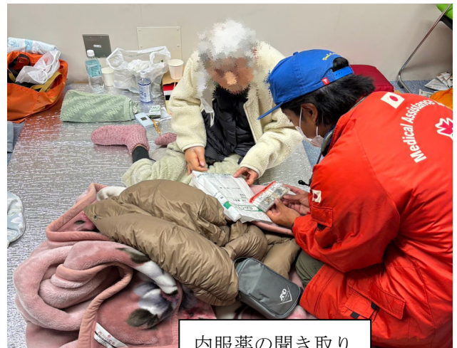
内服薬の聞き取り