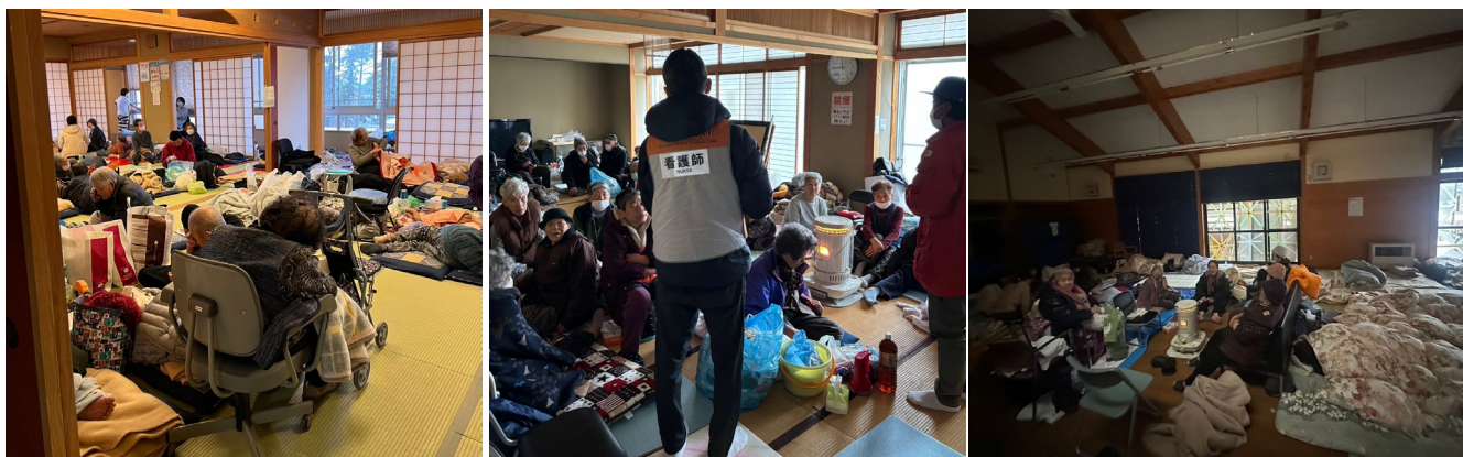
輪島市内避難所の様子

https://congrant.com/project/npotmat/9905