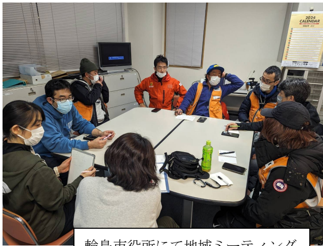
輪島市役所にて地域ミーティング