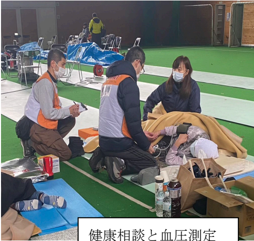
健康相談と血圧測定