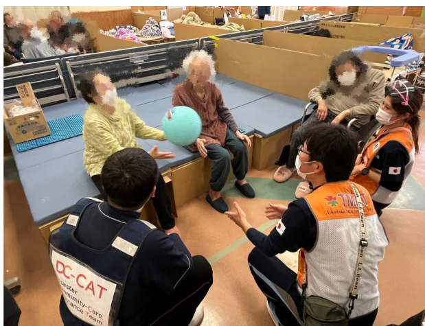
デイスペースにてレクリエーションを実施