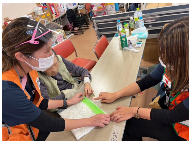
除圧のためのジェルクッションを作成